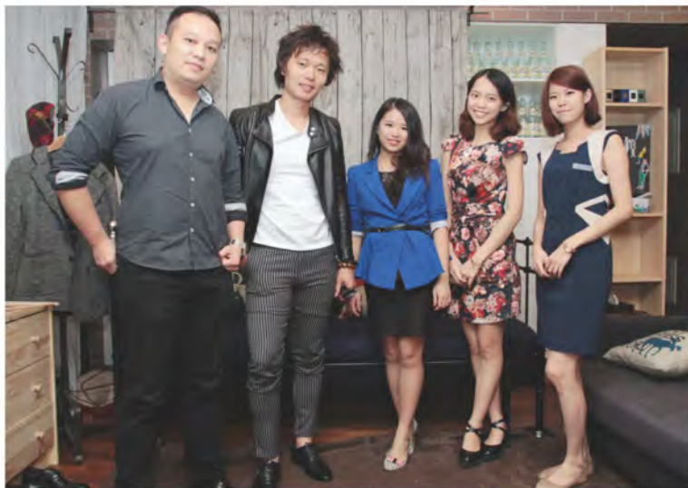
圖：Fersonal團隊與金牌師傅們