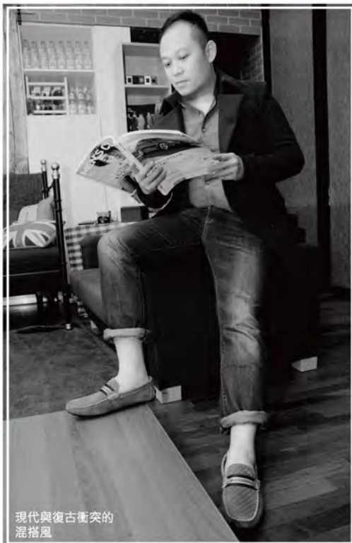
現代與復古衝突的 混搭風